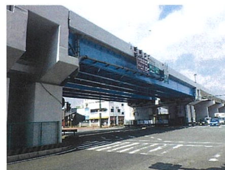
国土交通省 奈良高架橋