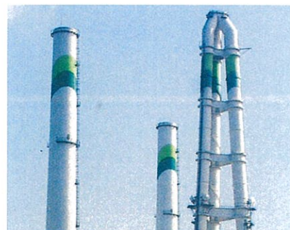
四日市火力発電所

高度化するプラント設備において、独自のノウハウと最新の技術力で煙突の機能・性能・美観を向上。煙突などの高層建造物実績から産業界より強い信頼を頂いております。