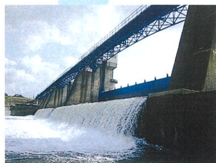
近畿農政局 岩出頭首工