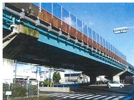
国土交通省 中里高架橋

橋梁塗装は、約10~15年周期で塗替えられています。劣化塗膜に応じた塗り替えが求められています。