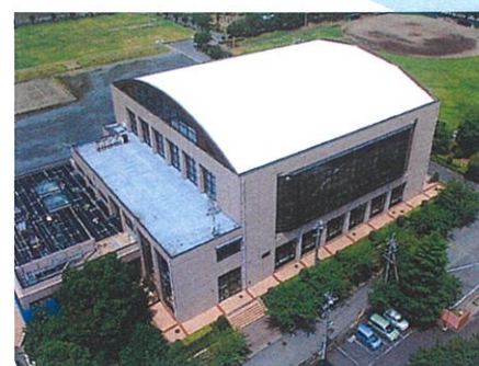
安八町総合体育館

建物だけでなく電源装置・通信設備に塗装する事により、熱対策と同時に設備を保護する事が可能です。